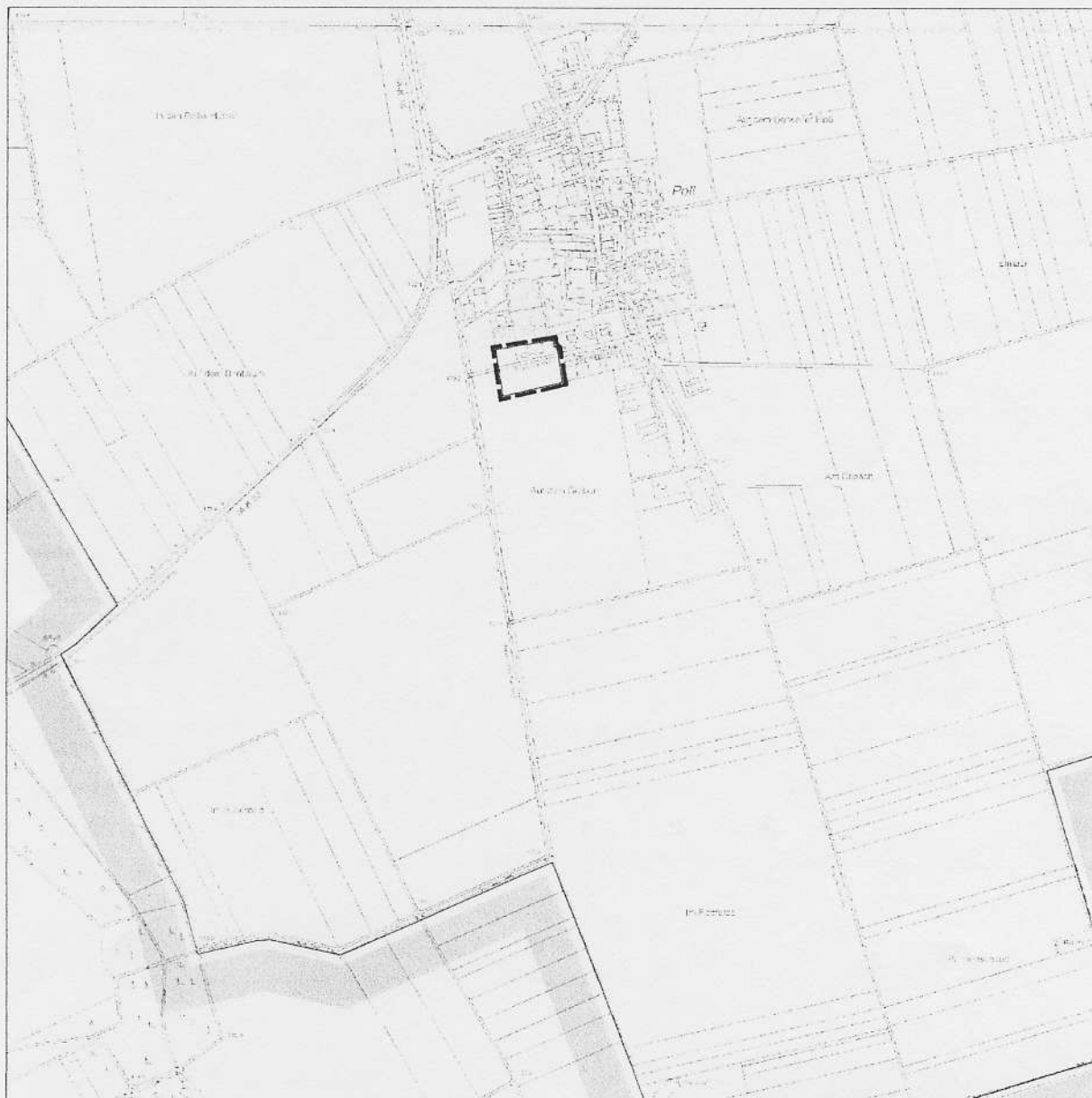
Übersichtsplan M 1 : 10.000